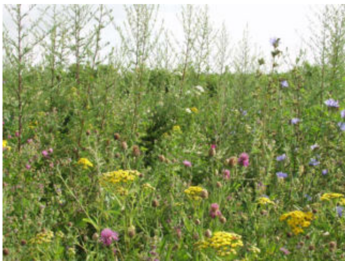
Bild 3: Die WPM BG 70 im 2. Standjahr (Sommer); Ernte im Juli.