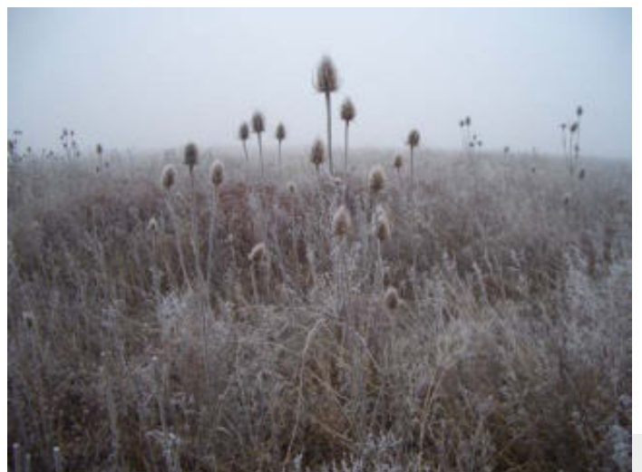
Bild 4: Blühflächen bieten sich als Ergänzung zu genutzten WPM an, da sie im Winter zusätzliche Sitzwarten für Vögel bieten.