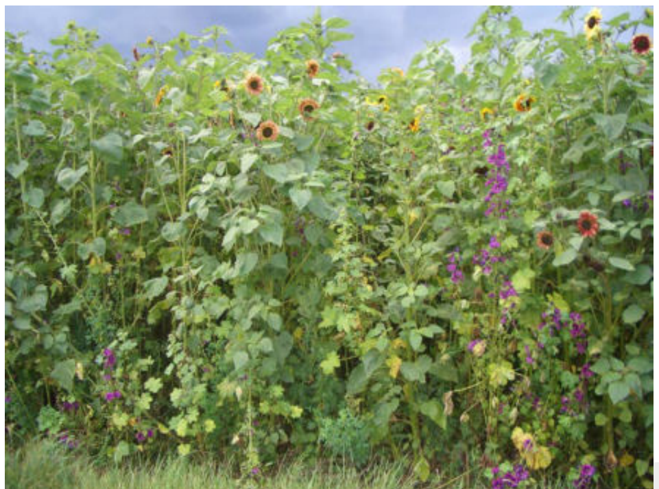
Bild 1: Die Wildpflanzenmischung für Biogasnutzung BG 70 im 1. Standjahr; Ernte zusammen mit Mais.

Im Projekt “Energie aus Wildpflanzen” soll eine ökonomisch tragfähige Ergänzung zu bisherigen Hauptenergiekulturen entwickelt werden, die gleichzeitig die Lebensbedingungen für wildlebende Tiere in der Agrarlandschaft verbessert. Im Rahmen des Projektes wurden auf Initiative des Bayerischen Staatsministeriums für Ernährung, Landwirtschaft und Forsten mit Unterstützung des Bayerischen Jagdverbands durch die Bayerische Landesanstalt für Weinbau und Gartenbau wildbiologische Begleituntersuchungen in Auftrag gegeben, die durch Mitarbeiter des Instituts für Terrestrische und Aquatische Wildtierforschung ITAW der Stiftung Tierärztliche Hochschule Hannover durchgeführt wurden.