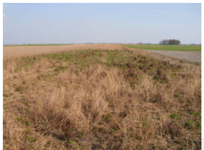
Bild 2: Zusätzliche Winterstrukturen der WPM bieten Nahrung und Deckung für Wildtiere.